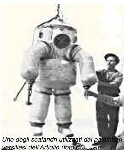
Uno degli scafandri utilizzati dai palombari versiliesi dell'Artiglio (foto d'epoca)

Sylvia Earle ha compiuto più di 400 spedizioni nei mari di tutto il mondo ed è stata a capo del primo gruppo di donne "aquanauts" durante il Progetto Tectite. Sylvia Earle dopo avere ottenuto il dottorato alla Duke University, è stata insignita di ben 15 lauree honoris causa da Università di tutto il mondo; ha al suo attivo oltre 150 pubblicazioni scientifiche, circa 20 volumi (tra cui alcuni per bambini) tutti inerenti la conoscenza della flora e della fauna delle profondità marine e