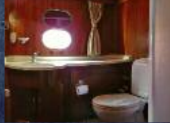
In ogni camera bagno e box doccia