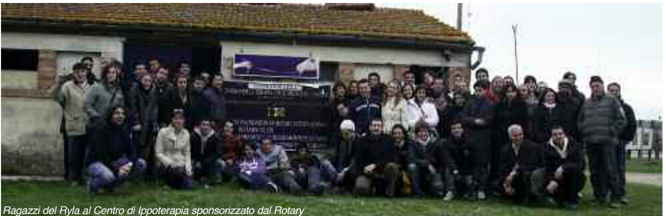
Ragazzi del Ryla al Centro di Ippoterapia sponsorizzato dal Rotary