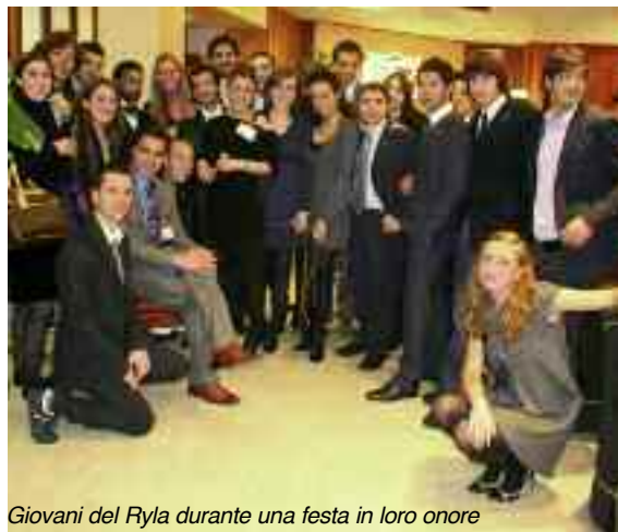
Giovani del Ryla durante una festa in loro onore