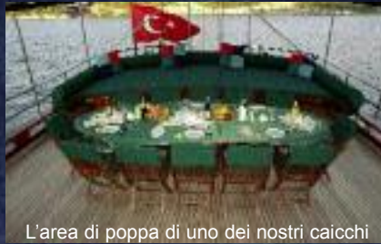
L'area di poppa di uno dei nostri caicchi