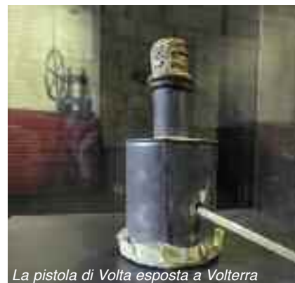
La pistola di Volta esposta a Volterra

A questo proposito, è stato inaugurato il 18 Aprile 2009 uno spazio esposi-