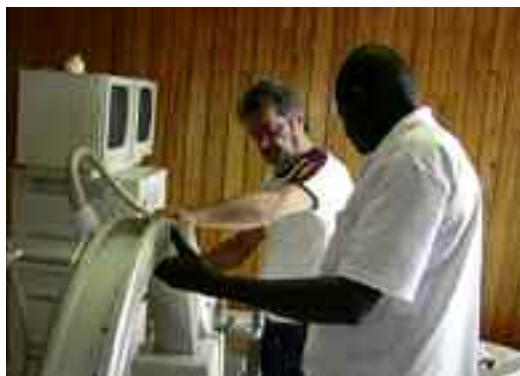
Le due unità radiologiche portatili durante i controlli e l'installazione presso il Benedict Medical Center di Kampala