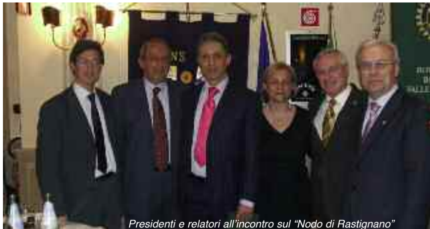
Presidenti e relatori all'incontro sul "Nodo di Rastignano"