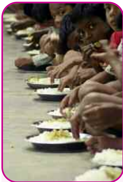
Nella foto di prima pagina un'immagine emblematica: bambini del Terzo Mondo che mangiano con voracità un piatto di riso