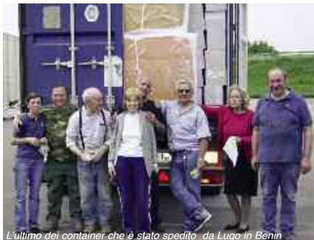
L'ultimo dei container che è stato spedito da Lugo in Benin

con i suoi due forni sempre in funzione, la Diocesi sarà idonea alla produzione e vendita di pane in una città con oltre 50.000 abitanti, la maggior parte dei quali (circa il 92%) di fede musulmana, e con un solo altro forno