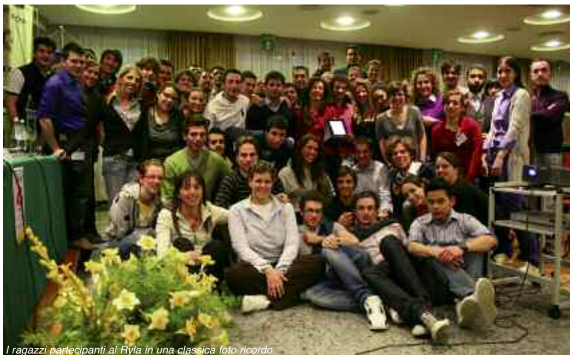
I ragazzi partecipanti al Ryla in una classica foto ricordo